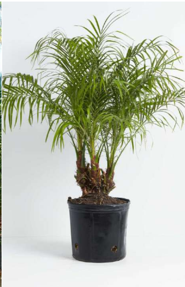
PHOENIX ROBELINII (MULTI)