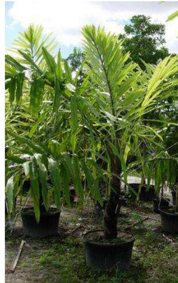
LIVISTONA AUSTRALIS (MULTI)